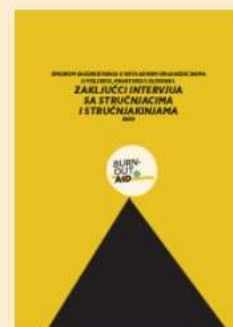
Intervjui sa stručnjacima

Nadamo se da će rezultati našeg istraživanja predstavljati važnu poruku u trenutnoj raspravi o organizacijskoj kulturi u NVO-ima, doprinijeti razbijanju tabua sindroma sagorijevanja i biti osnova za poduzimanje potrebnih korektivnih radnji. Rezultate izvještaja preuzmite na službenoj stranici projekta burnout-aid.eu .