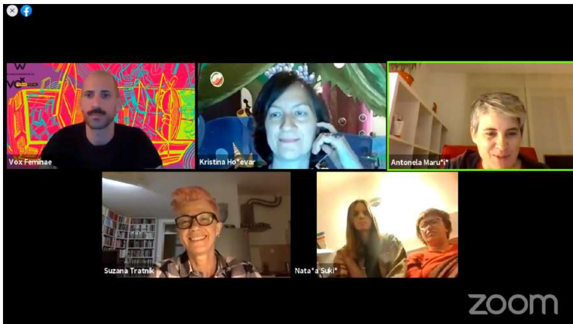
Four Voices: Lezbijska četvrt

U izvedbenom i umjetničkom programu održana je premijera kamišibaj predstave Kozlići nastale po predlošku Vesne Parun 'Mačak Džingiskan i Miki Trasi' (8.5.), online izložba Tee Štokovac 'In Bed' (9.5.), projekcija dokumentarnog filma 'Nepodobni' i razgovor s Duginim obiteljima (15.5.), video koncert benda Žen (22.5.), premijerno predstavljanje fanzina poezije potlačenih Centra za kazalište potlačenih Pokaz (23.5.) te video izvedba Petre Brnardić 'Tarantula' (24.5.).