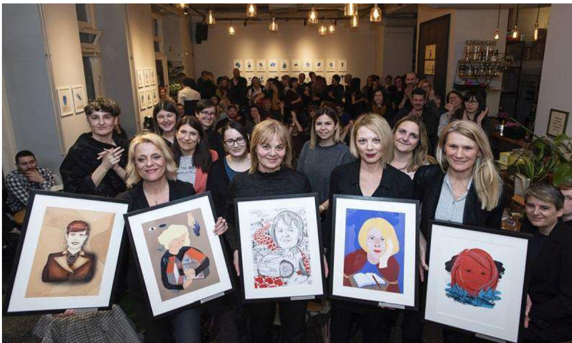
Dodjela WOW nagrada za za strašnu ženu godine 2020.

Udruga je uz navedeno u 2020. radila na provedbi dodatna dva međunarodna projekta Women on Women i BurnoutAid , te je nastavila s provedbom projekta Radnopravnost svima! (WorkplaceEquality for All) kojeg financira Europska unija iz Programa o pravima, jednakosti i građanstvu Europske unije (2014.-2020.).