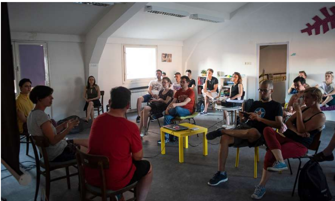
Projekcija filma 'Ja bi da to imam doma' u Šesnaestici

U Šesnaestici je kontinuirano tijekom godine dostupan štender za odjeću gdje korisnice prostora mogu ostaviti odjeću za druge, ili besplatno preuzeti neki od artikala. Ovom aktivnošću potiče se razmjena dobara koja još uvijek imaju uporabnu vrijednost među lokalnim stanovništvom.