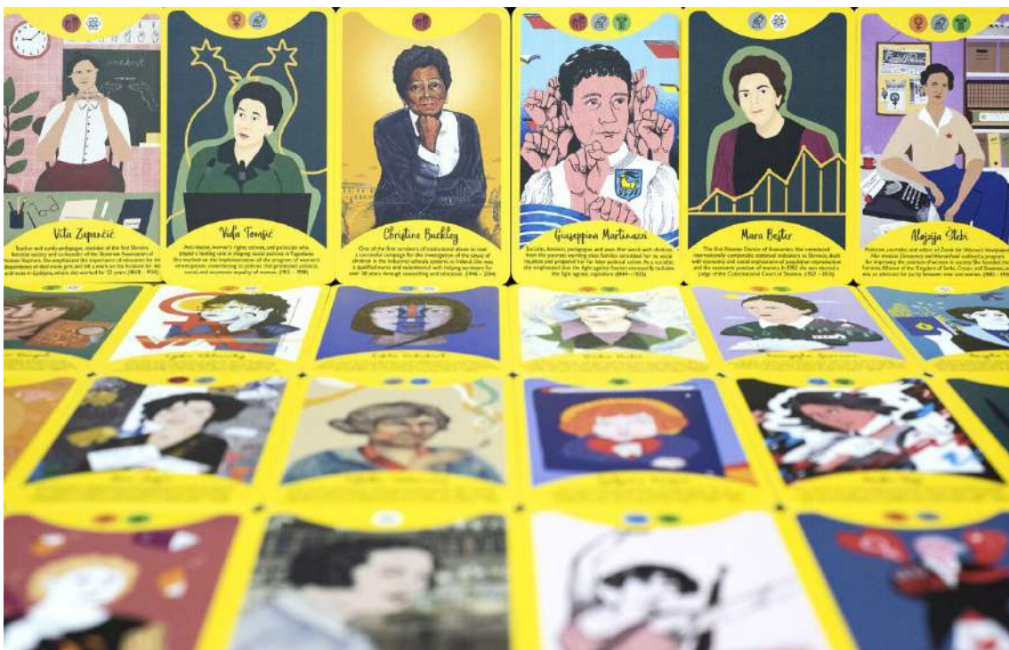
Fierce Women WOW karte

WoW FW Karte - Producirana je dodatna edicija društvene igre Fierce Women koja uključuje 30 dodatnih žena koje su ostavile traga u povijesti Hrvatske, Irske, Slovenije i Sjeverne Makedonije. Portrete dodatnih 30 žena kreirali su umjetnici/e iz čitave Europe, izabrani na temelju internacionalnog javnog poziva. Na javni poziv pristiglo je više od 300 prijava, a za rad na novom špilju izabrano je njih 15. Projektni timovi napravili su izbor žena te istražili i napisali njihove kratke biografije za karte, a novi špil produciran je u 2000 primjeraka koji se besplatno dijele u edukativne svrhe.