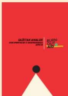
Analiza postojeće dokumentacije