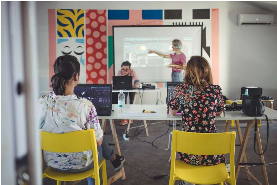
Edukacija o glazbenom i DJ stvaralaštvu

Tijekom godine K-zona je u Šesnaestici organizirala raznovrstan program koji se provodio kroz tri modula : 1) Razvoj i provedba programa neformalnog obrazovanja u kulturi i kreativnog korištenja slobodnog vremena, 2) Razvoj i provedba programa nezavisne kulture i 3) Razmjena, suradnja i umrežavanje s intrasektorskim i lokalnim akterima na polju nezavisne kulture te lokalnim stanovništvom.