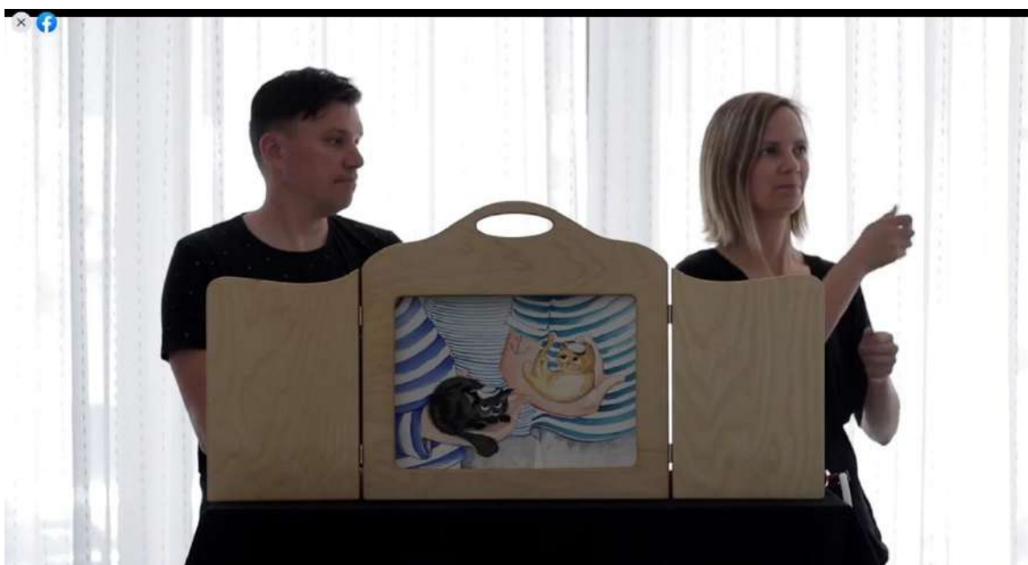
Kozlići: Mačak Džingiskan i Miki Trasi